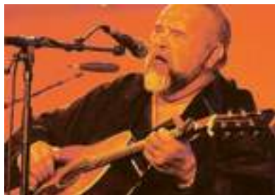
John Martyn, scomparso a 60 anni

Inspiratore degli U2 e di Clapton, nei suoi dischi complessi e difficili scomparivano i confini fra i generi musicali