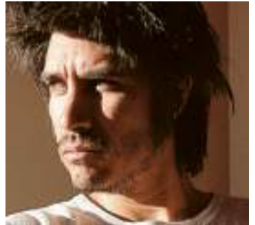
DAL CILE GIOVANI D'ASSALTO