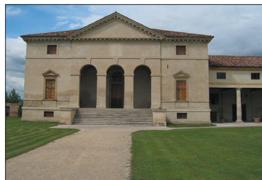
■ La Villa Palladiana Saraceno restaurata da Doglioni nel 1989

A Villa Malpigli vicino a Lucca, uno dei rarissimi edifici che ha ancora gli scuri originali del 1490, ed è senza finestre, dopo una lunga riflessione il proprietario ha deciso di lasciare così una parte della villa. Si è reso conto che così è una cosa unica al mondo. Mettendo i vetri per utilizzare quella parte della villa ne avrebbe perso la peculiarità. Questo è un caso estremo della negoziazione di cui parlo nel libro e che porta il progetto ad analizzare cosa perdo e cosa guadagno con le scelte che ho davanti. L'altro esempio interessante è la ricostruzione del Duomo di Venzone dopo il terremoto, che è partito proprio prima di ogni cosa da un progetto culturale. E nel quale non si è cercato di dissimulare le distruzioni del terremoto. Certo il Duomo, pur con le sue pietre, non è più quello di prima, ma nel confronto fra antico e ricostruito, le tracce del terremoto semmai danno una forza in più all'edificio. ■