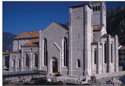
■ Il Duomo di Venzone restaurato dopo il sisma del 1976 in Friuli

nea come ogni intervento debba essere il risultato di un progetto che è prima di tutto culturale, un manifesto di intenti che deve essere condiviso da committente e progettista. «Questo è uno degli elementi centrali del mio libro - ragiona Doglioni - perché questa fase fondamentale fa del restauro un'espressione del pensiero contemporaneo, non solo un'attività pratica».